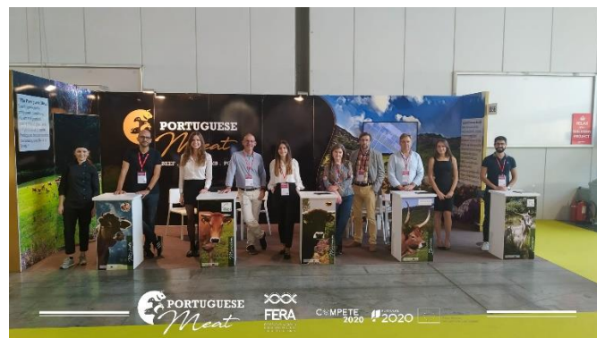
Participação na Feira TUTTOFOOD MILANO (Itália)