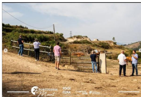
Realização de Missão Inversa (Baião)

Os resultados do projeto encontram-se resumidas na tabela seguinte: