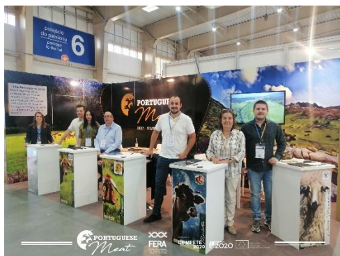
Participação na Feira POLAGRA FOOD (Polónia)

Apresentam-se de seguida registos fotográficos referentes às ações do projeto: