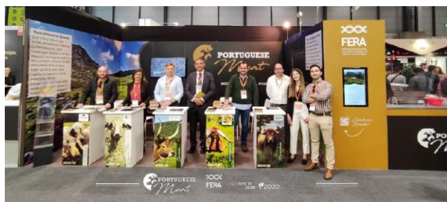
Participação na Feira SALON GOURMETS (Espanha)